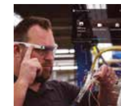
AR assistance for field or factory staff!

Η PowerX.tech φέρνει εκθετικές τεχνολογίες, λύσεις και νοοτροπία στον Heda!