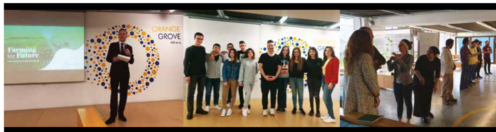
Bootcamp Day 2 for participants in our Farming the Future!